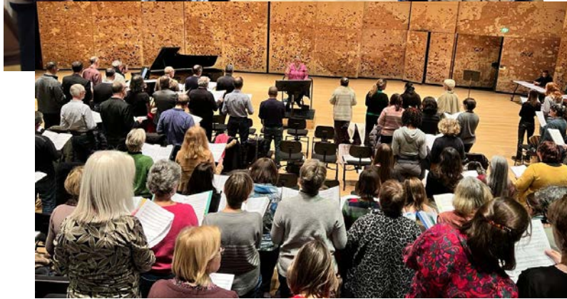
Direction pédagogique du projet « Europa » Philharmonie de Paris Les métaboles Orchestre de la Garde républicaine Saison 22/23