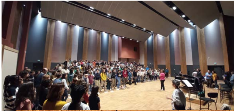
Direction pédagogique du projet « Ecce homo, Ecce Paris » ONDIF - Maison de l'orchestre Saison 22/23